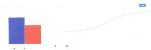
DESEMPENHO CARTEIRA VALIPREV - janeiro a julho de 2023: